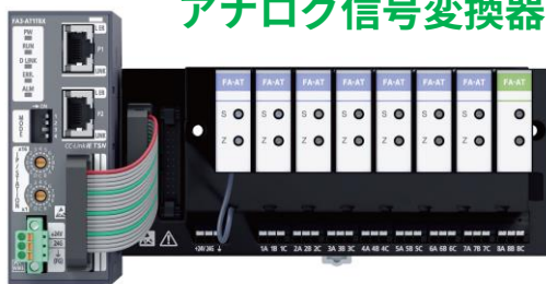
アナログ信号変換器